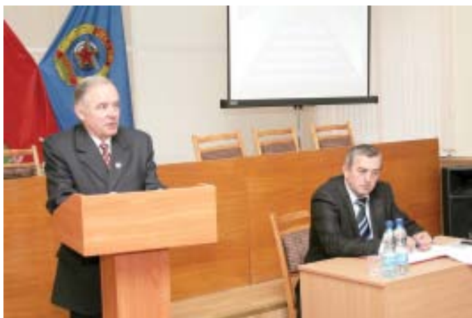
«Круглый стол» молодежного клуба «Патриот» при Республиканском Доме ДОСААФ на тему «Воспитание гражданина и патриота – забота общая» прошел в Минске в начале октября.

В мероприятии приняли участие представители ДОСААФ, Комитета по образованию Мингорисполкома, представители Министерства обороны, Белорусского союза офицеров, БРСМ, объединенного профсоюзного комитета ДОСААФ, заместители руководителей учебных заведений по идеологической и воспитательной работе, преподаватели допризывной подготовки, а также учащиеся.