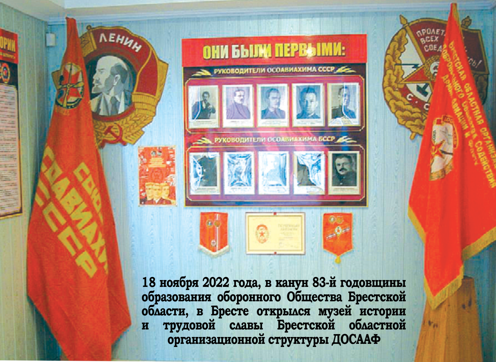
18 ноября 2022 года, в канун 83-й годовщины образования оборонного Общества Брестской области, в Бресте открылся музей истории и трудовой славы Брестской областной организационной структуры ДОСААФ