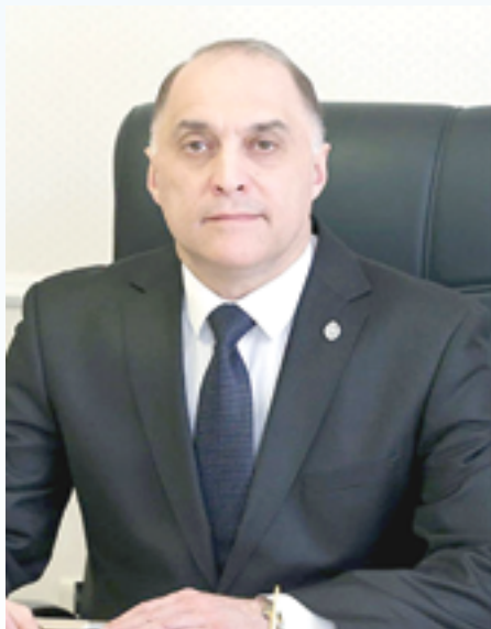
Государственный секретарь Совета Безопасности Республики Беларусь А.Г.Вольфович

Руководству; коллективу и ветеранам Добровольного общества содействия армии, авиации и флоту Республики Беларусь