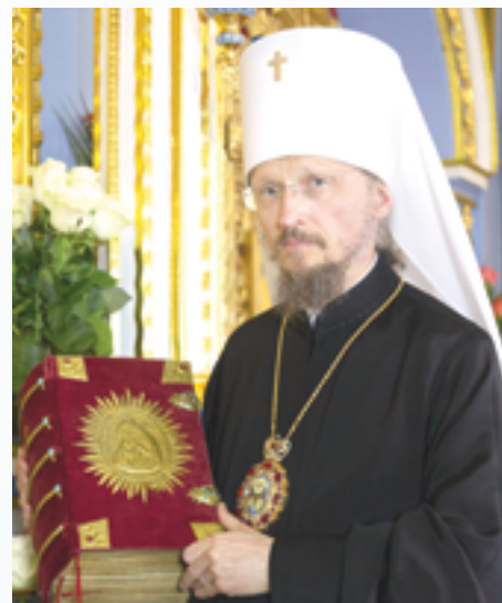
Митрополит Минский и Заславский, Патриарший Экзарх всея Беларуси Вениамин

Искренне желаю членам общества вдохновения для созидательного труда на благо родной страны. Пусть каждый приложит